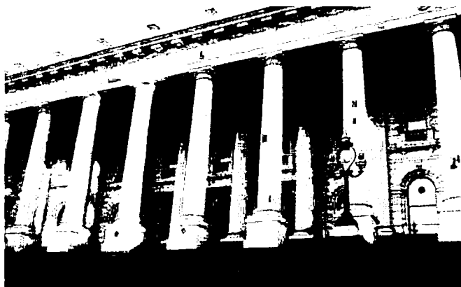
クイーンズホールのあるビクトリア州議会議事堂